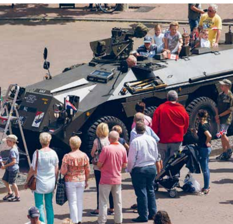
Er zijn verschillende legervoertuigen te zien en er kan een ritje gemaakt worden.