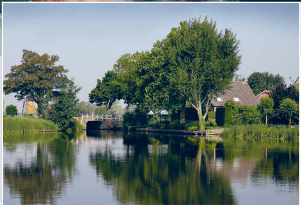
Huidige situatie. Waaloever vanaf Schalksedijkje in Rijsoord, 2018.

“Via de kunstenaars is de geschiedenis van Rijsoord voor