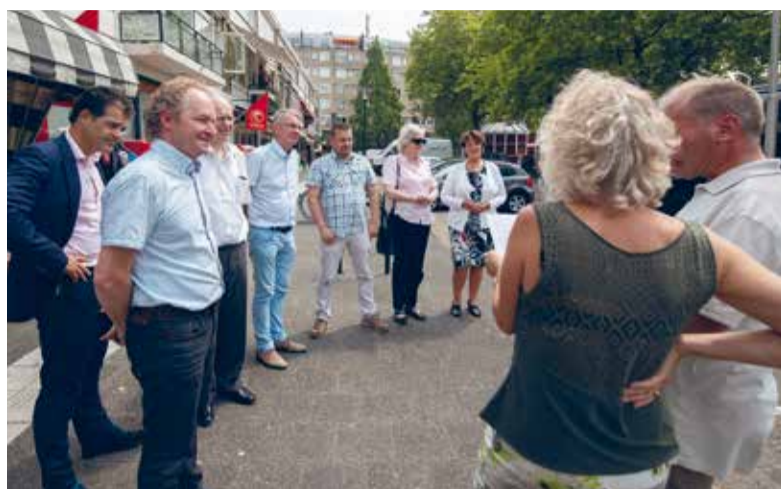
Het nieuwe college maakte een rondrit door alle wijken van Ridderkerk.

Ook in de ambtelijke organisatie wordt hierop stevig ingezet. De medewerkers van het Bureau Bestuursondersteuning