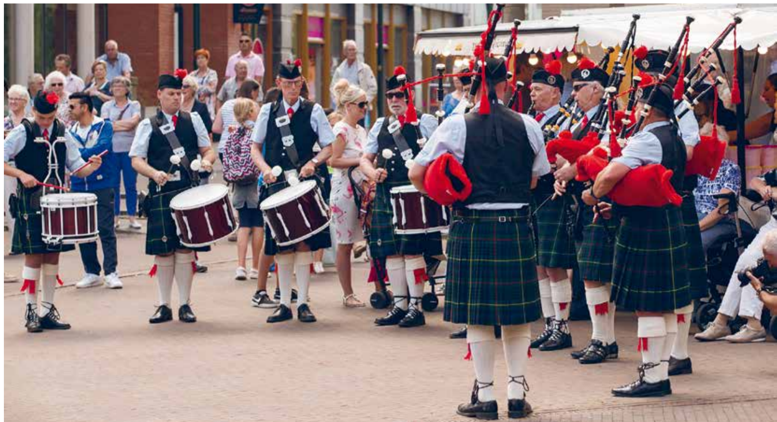
De Saint Andrews Pipe Band is dit jaar weer van de partij op de Ridderkerkse Veteranendag

Maak deze middag een ritje met de TRIS-legervoertuigen of neem een kijkje in een (schuim)blusvoertuig (de E-One Crashtender). Op het Koningsplein kunt u op een van de vele terrasjes genieten van het programma. Er zijn poffertjes en voor de kinderen is er een klimwand. Een middag om zeker niet te missen!